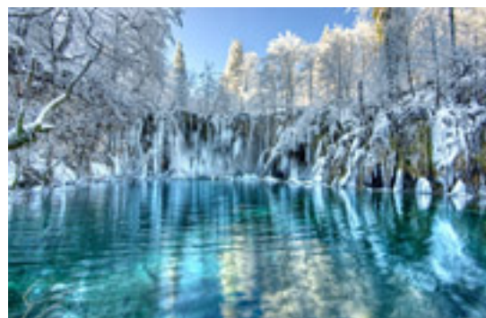
10 プリトヴィツェ湖群国立公園 世界遺産