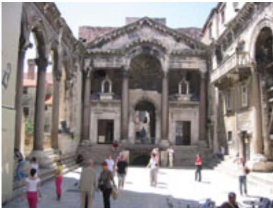
7 スプリット 世界遺産