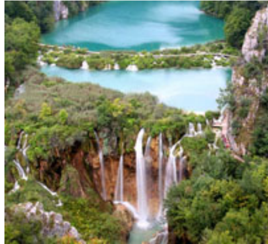
12 プリトヴィツェ湖群国立公園 世界遺産