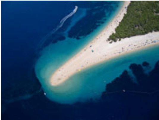
5 アドリア海ビーチ