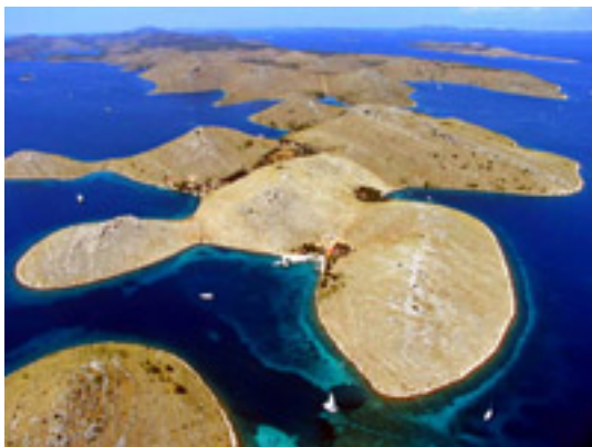
15 コルナティ国立公園