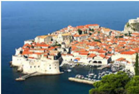
1 ドブロブニク 世界遺産

今年の IFTA 大会が開催されるボスニア・ヘルツェゴビナの隣国であるクロアチアのテクニカル・アナリスト協会 (CTAA: Croatian Technical Analysis Association) から、数々の写真ファイルを頂きました。美しい国土を持つ同国には毎年多くの人を訪れますが、その理由がうかがえるのではないかと思います。