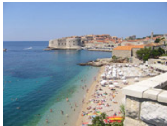
2 ドブロブニク 世界遺産