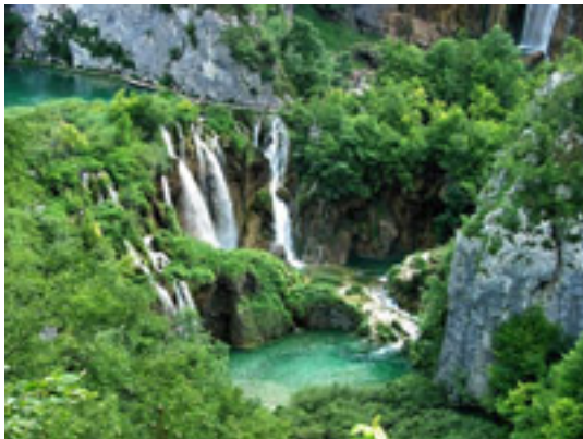
13 プリトヴィツェ湖群国立公園 世界遺産