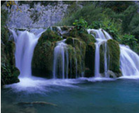
11 プリトヴィツェ湖群国立公園 世界遺産