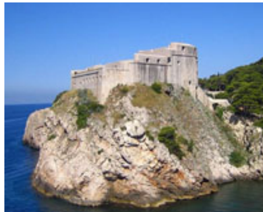
4 ドブロブニク世界遺産