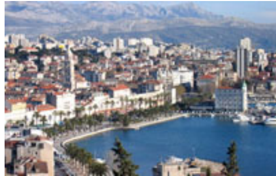
6 スプリット 世界遺産