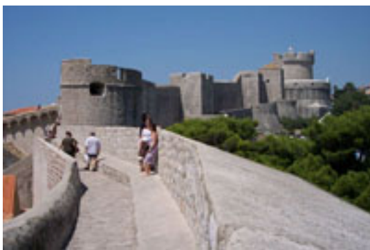
3 ドブロブニク 世界遺産