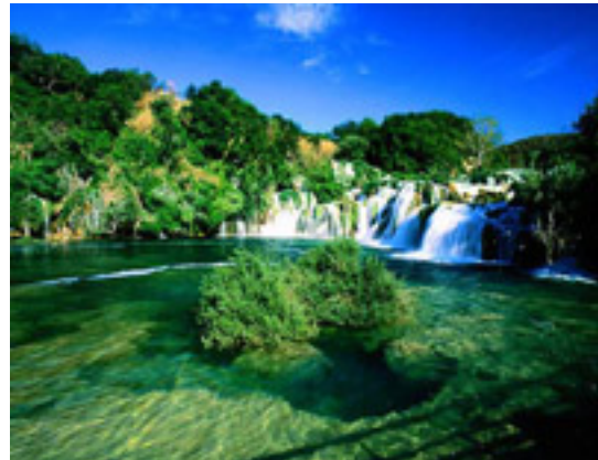
14 プリトヴィツェ湖群国立公園 世界遺産