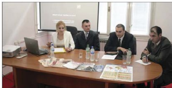
Brzi transfer najboljih praksi