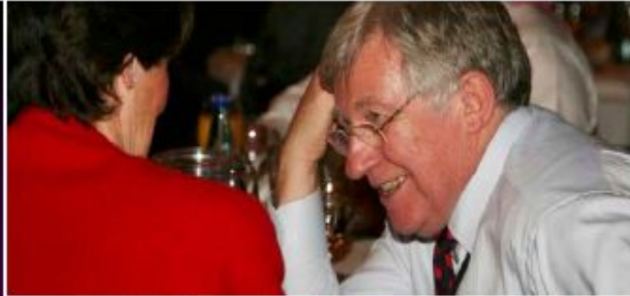
ロバート・グリッグ氏(オーストラリア・テクニカルアナリスト協会会長)