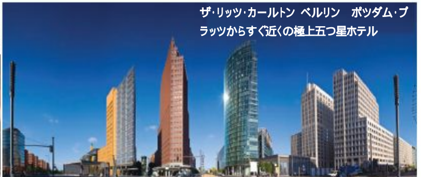
ザ・リッツ・カールトン ベルリン ポツダム・ブラッツからすぐ近くの極上五つ星ホテル