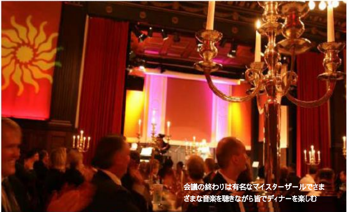
会議の終わりは有名なマイスター・ザールでさまざまな音楽を聴きながら皆でディナーを楽しむ