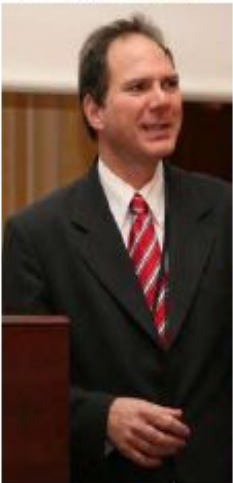
スピーカー兼議長のグレゴール・パウアー博士(ドイツ・テクニカルアナリスト協会インディペンデント・ポートフォリオ・マネジャー)